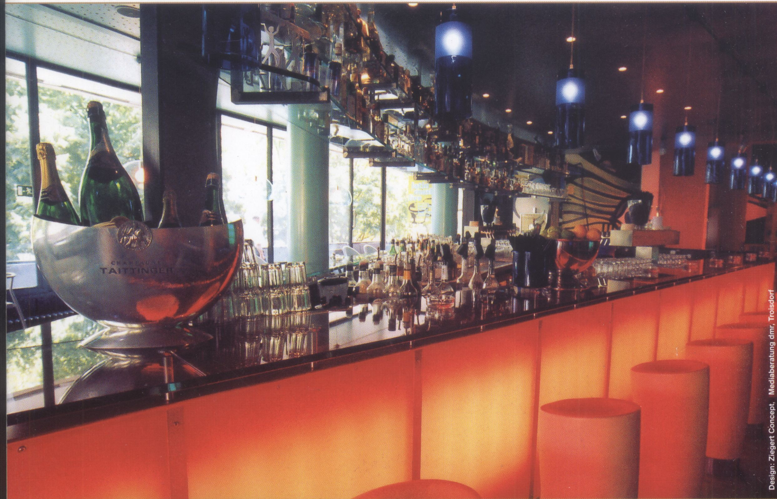
Design: Ziegert Concept, Mediaberatung dmr, Troisdorf